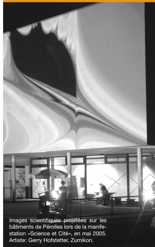
Images scientifiques projetées sur les bâtiments de Pérolles lors de la manifestation «Science et Cité», en mai 2005. Artiste: Gerry Hofstetter, Zumikon.